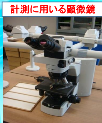
計測に用いる顕微鏡